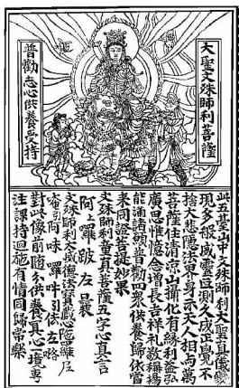
图6 大圣文殊师利菩萨像 英国国家图书馆藏

此外，在敦煌藏经洞出土的其它佛教版画中我们也能看到类似图式的沿袭和发展。如现藏英国国家图书馆的《大圣文殊师利菩萨像》也为敦煌当地作品。（如图6）图中菩萨戴宝冠披璎珞，手执如意正面端坐，后有项光及背光，两旁有胁侍童子及牵狮力士，足下祥云冉冉，下部作真言咒语文字。这幅版画特殊之处是该版画有版框两栏，上栏为文殊菩萨骑狮像，下栏为楷书题记，图像和文字已各占一半。就单页的形式来看，更接近后世插图本的上图下文形式，并且文字在画中的信息量明显增加，内容也丰富起来。文字和画面相互作用，画面是文字的形象化身，文字是画面的补充说明，因此可以将其看作后世插图本演进过程中的重要阶段。1959年7月在敦煌莫高窟大泉河东岸元代喇嘛塔中发现的《妙法莲华经·观世音菩萨普门品》，为西夏崇宗时期刻本，梵夹装，西夏文，页面高20.5cm，宽9cm。首页为《水月观音图》扉画，余页皆为上图下文，上部三分之一为插图，下部三分之二为经文，文字的信息量已经超过了图像的数量，标志着北宋西夏时期插图本形式的最终定型，这也在另一个侧面反映了当时西夏王朝高超的雕版印刷技术水平。 [10]22