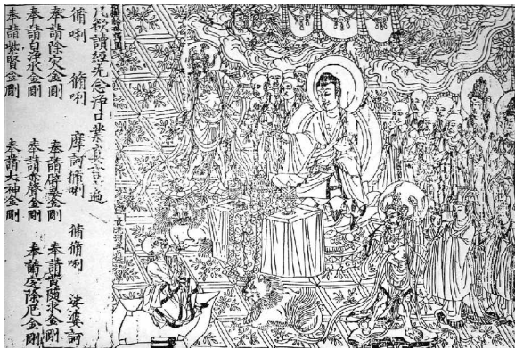
图2 祇树给孤独园 英国国家图书馆藏