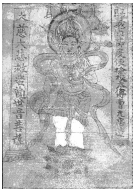
图5 大慈大悲救苦观音菩萨像 英国国家图书馆藏