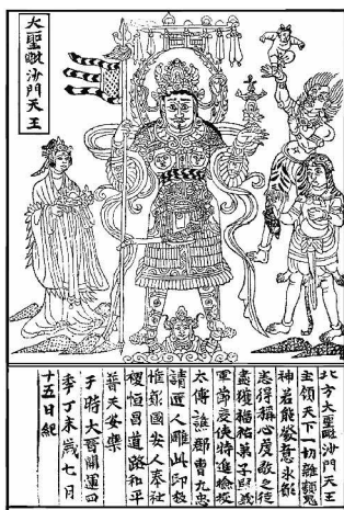
图3 大圣毗沙门天王像 英国国家图书馆藏

言，敦煌版画多数为佛教版画，但这其中也有为数不多的几件非宗教类版画作品。比较典型的有英国国家图书馆藏敦煌遗书《唐僖宗乾符四年(877年)具注历日》(如图4)。该历日在每个项目都有纵横细线界栏，使读者在阅读时不易串行。刻工在雕刻时就已考虑到历日的多功