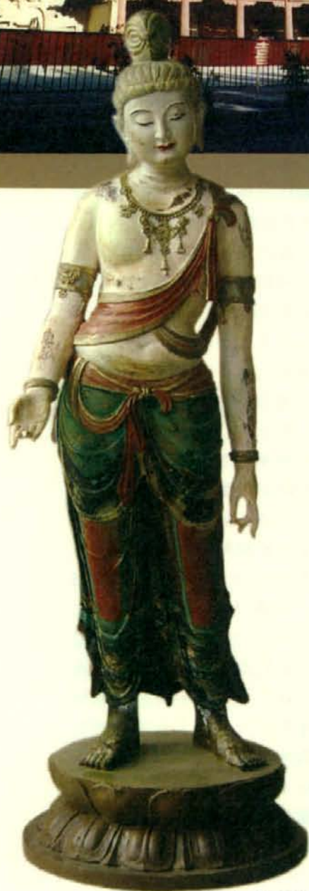
莫高窟中的精美泥塑

商人传来了敦煌莫高窟发现藏经洞的消息。于是，这支古代文化劫掠的“八国联军”又先后动身，急急向坐落在塔克拉玛干沙漠和罗布荒漠东面的敦煌奔去。