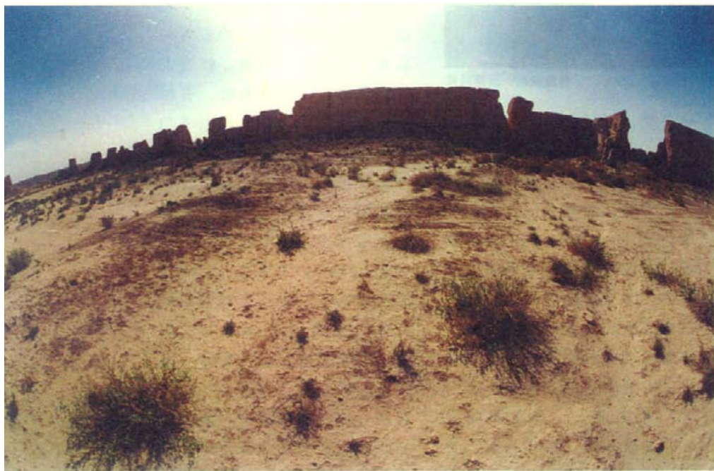
敦煌附近的古城遗址

此时，河西地区为卢水胡沮渠蒙逊所建的北凉政权所统治。412年10月，沮渠蒙逊迁都姑臧，并以姑臧为中心，在河西各地修建佛寺，开凿石窟，形成以天梯山石窟为代表的“凉州模式”，很快向周围地区扩散，敦煌也深受其影响。439年6月，北凉为北魏所灭，凉州石窟僧人纷纷外流，其中一部分西行，加入了敦煌莫高窟的开窟队伍中，使敦煌的佛教地位取代凉州并逐渐升高，加之中原政权不断加强对敦煌的管理，敦煌作为丝绸之路上经济、文化交流中心的地位也日益凸现，使敦煌佛教自北周开