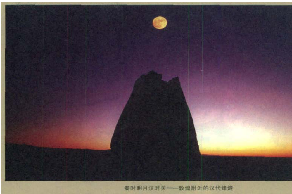
秦时明月汉时关——敦煌附近的汉代烽燧

19世纪末，沉寂多年的莫高窟迎来了一位来自湖北麻城的道士王圆箓。他逃荒至河西，原在酒泉巡防营当兵，退伍后流落敦煌，来到无人看管的莫高窟，重操旧业，将佛教寺院改建为道观，做起了道士。为了能在这个