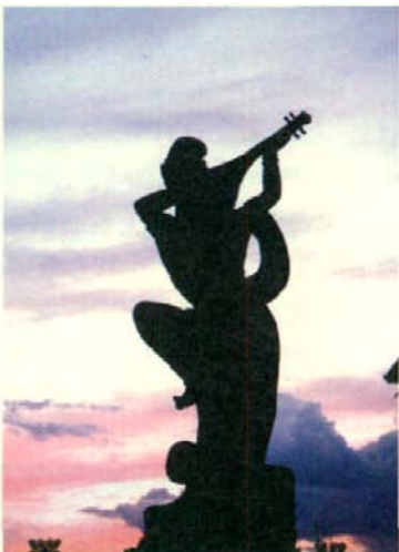
敦煌城标：反弹琵琶

公元前111年，汉武帝在河西置酒泉郡后不久，即从酒泉郡中分置敦煌、张掖二郡，敦煌郡辖境范围为阳关、玉门关以东，包括今安西、肃北在内的大片土地。敦煌郡设置以后，汉朝就将关内赤贫及罪臣、囚犯大量徙至敦煌屯田，使敦煌人口迅速增加。前108年，由于楼兰王依附