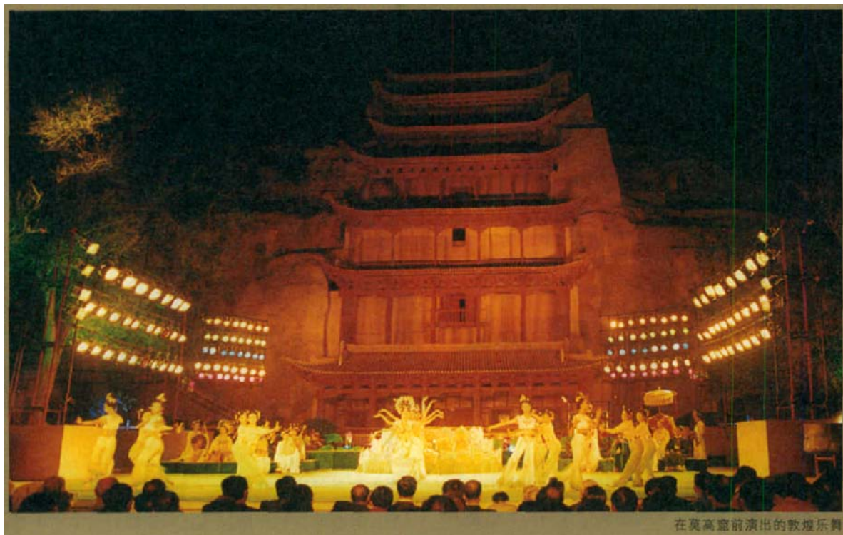
在莫高窟前演出的敦煌乐舞

不了美国人。他们用少得可怜的银子，从愚蠢的王道士手中换走了上迄东晋、下止宋初数量可观的写本、刻本和数以千计的唐、宋绢画，每一件都可说是价值连城！尽管中国学者在明白真相后奔走呼号，促使清政府下令将劫余遗书运至北京，但藏经洞遗书和莫高窟所遭受的惨痛损失，已经无法用语言来形容了！