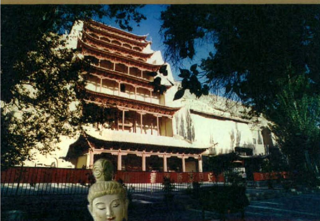
敦煌的骄傲——莫高窟