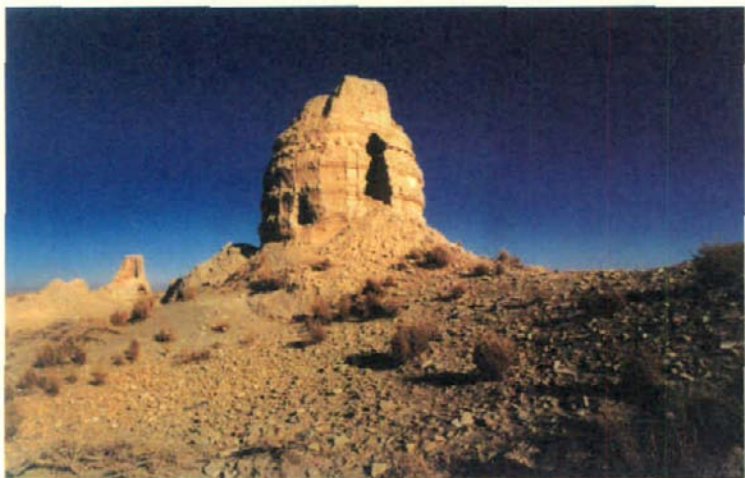
敦煌附近的古城——阳关遗址中的佛寺

藏经洞被发现的时候，正是八国联军自天津而上入侵北京的时候。苟延残喘的清政府，根本无暇顾及距京师万里之遥的戈壁小城敦煌所发现的注定要轰动世界的藏经洞瑰宝。而此时，国际间地理大发现的热潮方兴未艾，形形色色的探险家、情报人员、文物投机分子等，就陆续汇集到了新疆南部重镇喀什噶尔。他们当中有英国人、法国人、德国人、瑞典人、俄国人、日本人，甚至还有美国人和丹麦人，他们面对羸弱不堪的清政府，肆无忌惮、争先恐后地对散布在塔克拉玛干沙漠周围的古代城市遗址、寺庙和墓地等进行了疯狂的挖掘和劫掠。正当他们意犹未尽时，从古老而人烟稀少的丝绸之路上由驼队