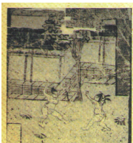
相扑图（敦煌莫高窟第17窟壁画 唐代）

“角抵是相扑、摔跤的前身。角抵的起源是上古时期原始社会中角力比武的竞技项目。”李重申教授认为：“敦煌壁画上角抵的内容反映了不同历史时期角抵的演变，对了解国际式摔跤、跆拳道、空手道、柔道、相扑、散打等方面的渊源形式和技法提供了珍贵、形象的资料。”