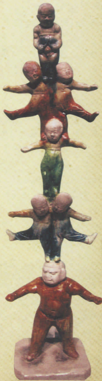
三彩叠罗汉俑（西安市长安区郭杜镇出土 唐代）

倏然之间，画师老去，兴盛之极的敦煌也曲终人散，留下了满目黄沙，只有洞窟和壁画默默地诉说着千年的沧桑巨变。