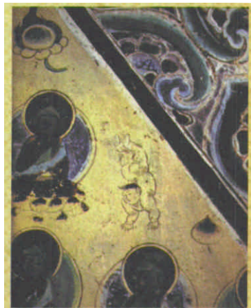
倒立图（敦煌莫高窟第79窟壁画 唐代）