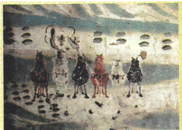
马术图（敦煌莫高窟第61窟壁画 五代）

随后人们逐渐把马匹的数量由一匹增加到了两匹、三匹，最后到了六匹，年轻的勇士竟然都一跃而过。