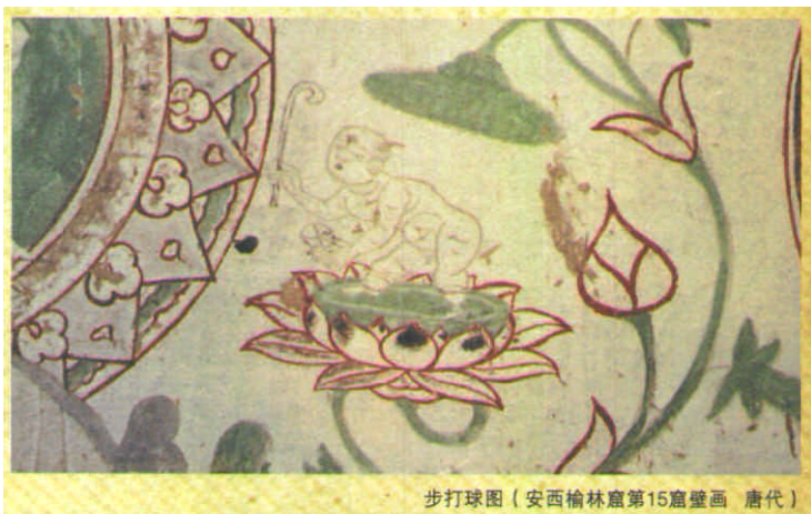
步打球图（安西榆林窟第15窟壁画 唐代）

步打球是一种和现代曲棍球或高尔夫球相类似的运动，其源头可以追溯到战国，真正兴盛却在唐代。到了宋代步打球又分出一种运动叫“捶丸”。宋徽宗、金章宗等都非常喜欢捶丸。到清代后，捶丸运动才逐渐消失。