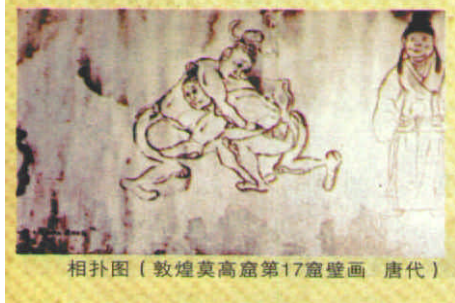
相扑图（敦煌莫高窟第17窟壁画 唐代）