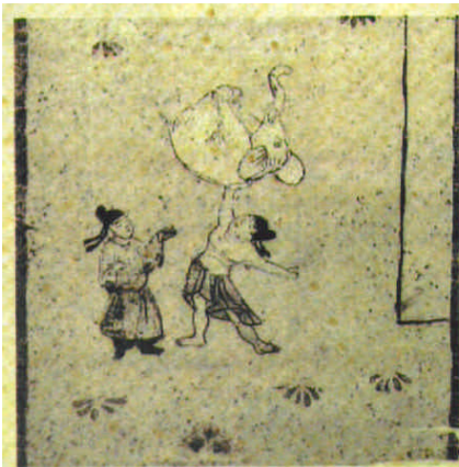
举象图（敦煌莫高窟第290窟壁画 唐代）

这是敦煌北周290窟人字披上的一个画面。这也是一组佛传故事的连环画，其总长度20多米。古代敦煌的画师们按照经卷画，表现了射箭、举重、举象等太子习武的故事。