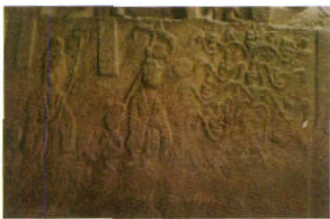
（图2. 第38窟东壁音乐树及供养人）

这是晚期石窟中雕刻内容最丰富的一窟，位于石窟区西部。北壁下层的“幢倒伎神”浮雕（图2），爬杆倒舞的缘幢杂技，旁边有以横笛、胡笳、排箫、阮咸、箫、细腰鼓等乐器为其伴奏的乐伎。其刻画的表现情况，也是研究中国杂技史的宝贵资料。东西两壁各雕两株七宝化生树，俗称“音乐树”，树枝头着花，花上各一童子各持天乐共奏，歌颂佛德。七宝树，是佛经中所描绘之树。《佛说无量寿经》：“又其国土，七宝诸树，周满世界……清风时发，出五音声，微妙宫商，自然相和。”“微风徐动，吹诸宝树，演出无量妙法音声”“第六天上万种乐音，不如无量寿国诸七宝树一种音声千倍也。”匠师巧妙地在化生树枝头