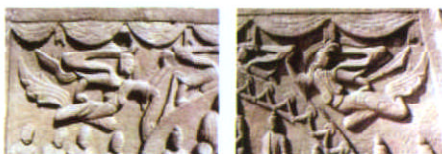
（图5、图6. 第34窟西壁飞天）

所谓飞天，是指窟中歌舞、奏乐的伎乐神像，这些神像都作凌空飞舞的形状，因而称作“飞天”。第34窟西壁的飞天（图5、图6），是云冈石窟中最美的飞天。这是云冈舞蹈艺术的升华，也是人间舞姿的艺术再现，她们或腾空而起御风而行，或足尖着地婀娜旋转，舞姿优美，柔若无骨，体现出盘旋、舒展、秀婉等诸多含义，石窟中所见双飞燕、吸腿跳、倒踢等动作，至今仍用于戏曲舞蹈和民间舞蹈中。雕刻的线条虽然粗犷，姿态却细腻传神，体现出一种大家闺秀的淑女风范。从艺术创作理念和艺术表现风格上，都体现了中华民族的审美意识。