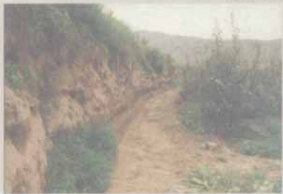
成纪古城现存的西城墙遗址

位置就在今天的静宁县境内。20世纪90年代中后期，人们在静宁县治平乡刘河村东南的一座古城遗址内，发现了大量秦汉时期的瓦砾、砖石以及属于那个时期的古墓葬，经多方考证，确认这座古城遗址为汉代的成纪县旧址。