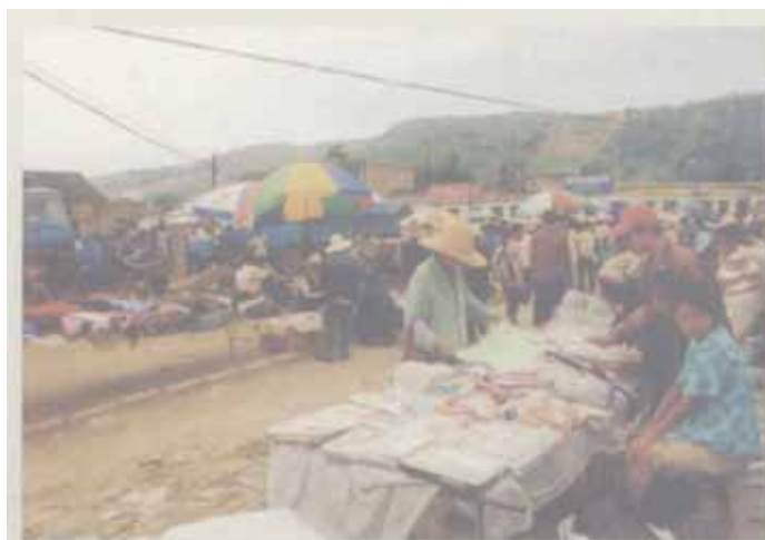
成纪古城旁的集镇

东距成纪古城不远处，是一个热闹的集镇。集市上车来马往，人头攒动。路边一位憨厚的老者，抱着他的小孙子，守着他车子上的葱、梨等物品，脸上充满了惬意和满足；一位卖蚰蚴的老乡，一边摆弄着他的蚰蚴笼，一边展示着他自拟的卖蚰蚴广告：自由的世界，美好的歌唱，售出快乐，快乐大师！世事沧桑，不管历史如何变迁，但生活的快乐却是代代相承的。