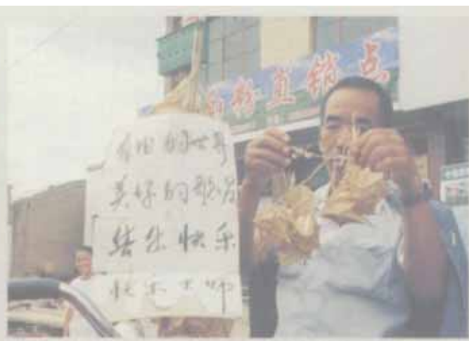
卖蚰蚴的“陇西成纪人”