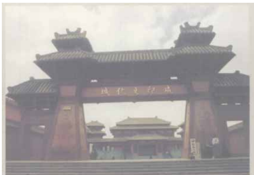
静宁县城内新建的“成纪文化城”

成纪古城遗址所在的静宁县治平乡，是一个位于两山之间的山间盆地，一条古称瓦亭水、葫芦河，今称治平河的河流，静静地向东向西，纵穿过盆地，盆地中因此草茂林密，庄稼葱茏，成纪古城就坐落在治平河南岸的一块高地上，东西长600余米，南北宽560余米，原来的古城墙十分厚实高大，可惜在修建乡间公路时大部被取土垫了路基，目前仅残存西北和东北部分城墙，城内外全为参差不齐的庄稼和果园所遮蔽，就连近