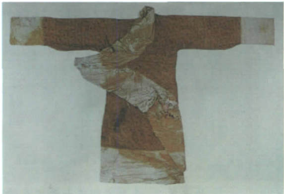
西汉信期绣茶黄绮曲裾棉袍(1972 马王堆一号墓出土)

汉代服饰图案主要表现在面料、花边、头冠等织物和玉器等配饰上。根据出土的服饰实物显示, 汉代服饰面料主要有绢、方孔纱、罗、绮等。绢是平纹素织物, 细薄的称为素、缟; 方孔纱是平纹假纱织物, 份量轻; 罗为四经纹织物, 这种织物必须用提花和绞综的机织机才能织造, 用来做刺绣锦袍、夹袍等; 绮为地纹单层平纹、花纹三上一下的经二重组织, 出土的有杯纹绮和复合菱形提花鸟纹绮。汉代服饰染色工艺继承西周以来的传统, 使用矿物、植物性颜料, 以白矾、黄矾、绿矾、皂矾、绛矾、石灰等作媒剂。矿物颜料中最主要的是丹砂, 分天然丹砂和人造丹砂两种。还有石黄、粉锡、铅丹、大青、空青、赭石、娟云母、硫化铅等。汉代