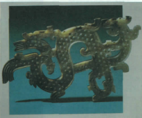
西汉龙凤纹玉佩(1977年江苏扬州妾莫书墓出土)