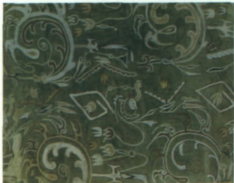
东汉茱萸纹绣裤脚边(局部)的纹样(1959 新疆民丰县北大沙漠1号墓出土)

服饰图案的装饰题材主要以动物、植物、几何纹、汉体铭文等为主。动物装饰图案有龙纹、兽纹、鸟纹(凤纹)和兽面纹(饕餮纹)、麒麟、仙鹿、仙人骑马等;植物装饰图案有莲花纹、茱萸纹、卷草纹饰等;几何纹以涡纹、卷云