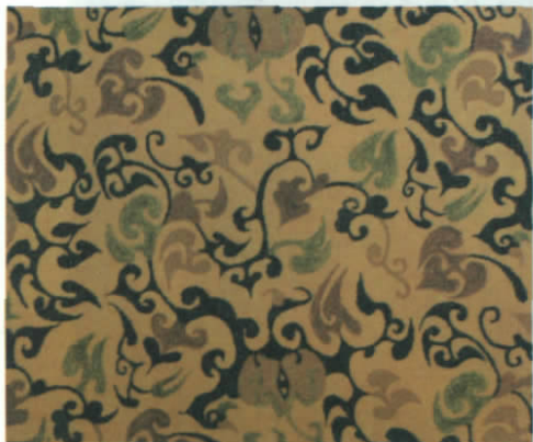
西汉“黄色对鸟菱纹绮地乘云绣”的纹样复原图

汉代服饰图案的装饰艺术,作为我国传统文化的见证,展示了当时社会文化的历史脉络,是文明进步的物质表现形式和历史确证。汉代服饰图案的装饰艺术是汉代人民情感思想的表达、精神的体现和汉代民族文化的积淀,是我国传统文化灵魂的流露,凝聚着中华传统历史和深刻人文内涵的装饰艺术,对于我国传统服饰文化发展具有较强的影响力。我们应该充分学习汉代服饰图案的装饰艺术的风格和特点,继承传统艺术的精华,并以当代化的设计观念为指导方向,赋予全新的设计思想,并应用到当代的服装设计或艺术设计中,形成符合现代社会审美与实用要求的设计理念,发扬我国艺术设计领域民族化的特点,更好地走向国际化发展。