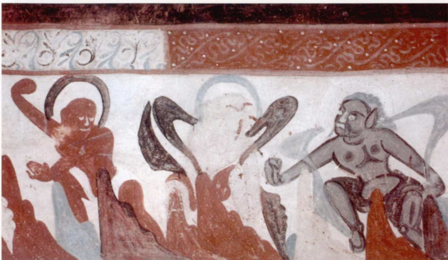
力士搏斗图壁画 北魏（甘肃敦煌莫高窟第251窟壁画）

的社会实践，并在发展中形成了具有独特民族风格的运动形式。在历史的发展中，它不但形成了各种各样的流派、系统的武术套路，而且具有独特的击技实用价值、全面增强体质健身作用和表演的艺术美。传统武艺形成的历史、传统武术体系的构成以及传统武术完整的文化内涵，在从古代武艺到武术形成的丰富内容中得到了充分的体现。这就是形成传统武术主要内容的武艺器械、徒手技击和器械演练。