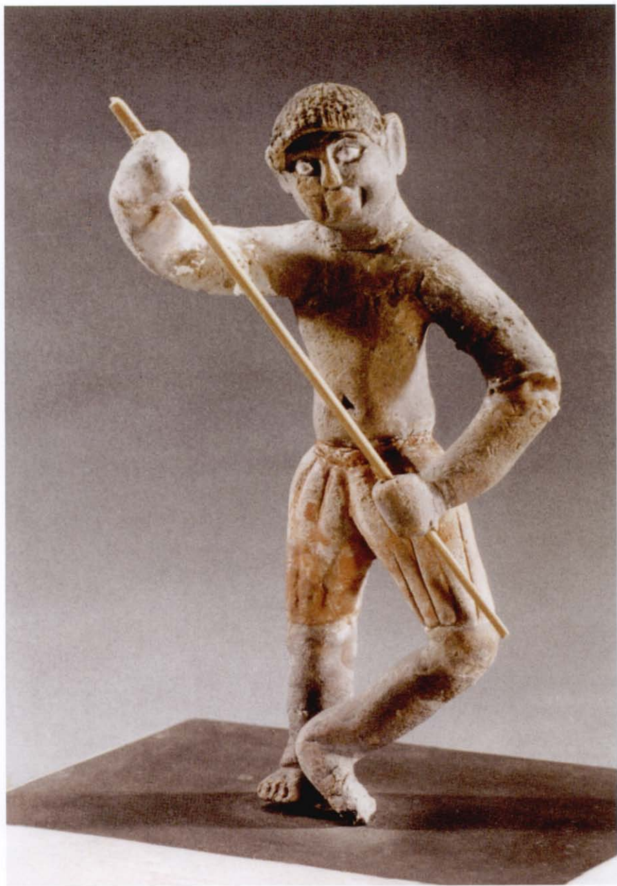
棍术武士泥俑 唐（新疆吐鲁番出土）

魏晋隋唐以后，武艺器械逐步规范化。尤其是宋元时期，随着武艺活动的进一步普及，武术理论得到了进一步发展。同时，由过去传承下来的各种武艺得到了更加系统的精练和荟萃。这就使以前诸种武艺逐渐形成了体系。至明清时期，武艺器械大抵包括如下种类：