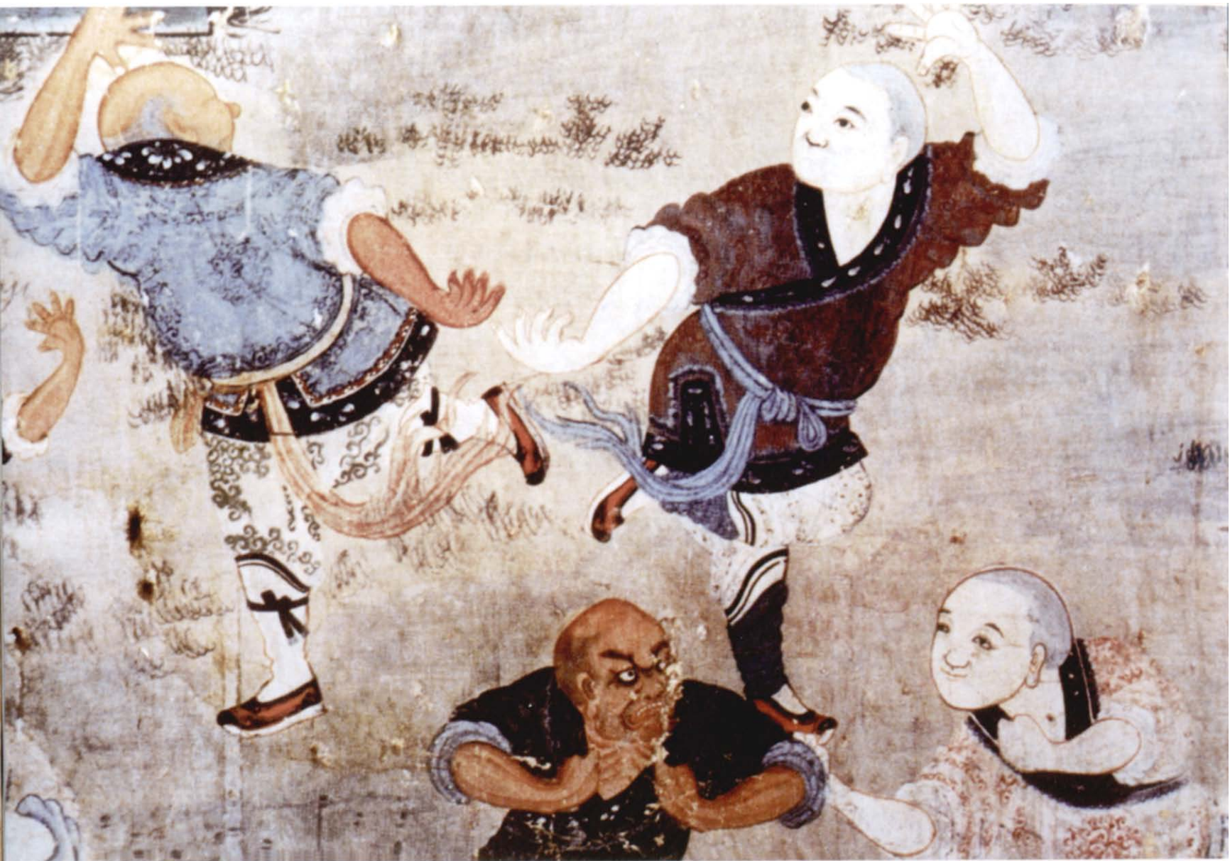
拳术演练图壁画 清（河南登封少林寺白衣殿壁画）

作为古代中国民间流行较为广泛的传统体育活动，传统武艺是集实战、表演和健身于一体的活动形式。它源于史前人类生产、生活