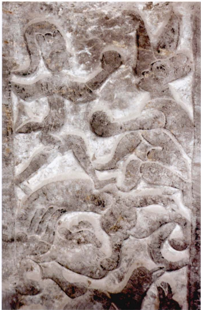
拳术演练图画像石 汉(山东省临沂市白庄汉墓出土)

以拳术为代表的徒手技击,是我国古代武艺向武术发展演变的一个重要的组成部分。明清时期的河南登封少林寺白衣殿拳术演练图壁画,中国体育博物馆收藏的青花、红釉瓷器上的拳术演练纹,都极为形象地向我们展示出了华夏武术中颇具特色的拳术套路的丰富内容。