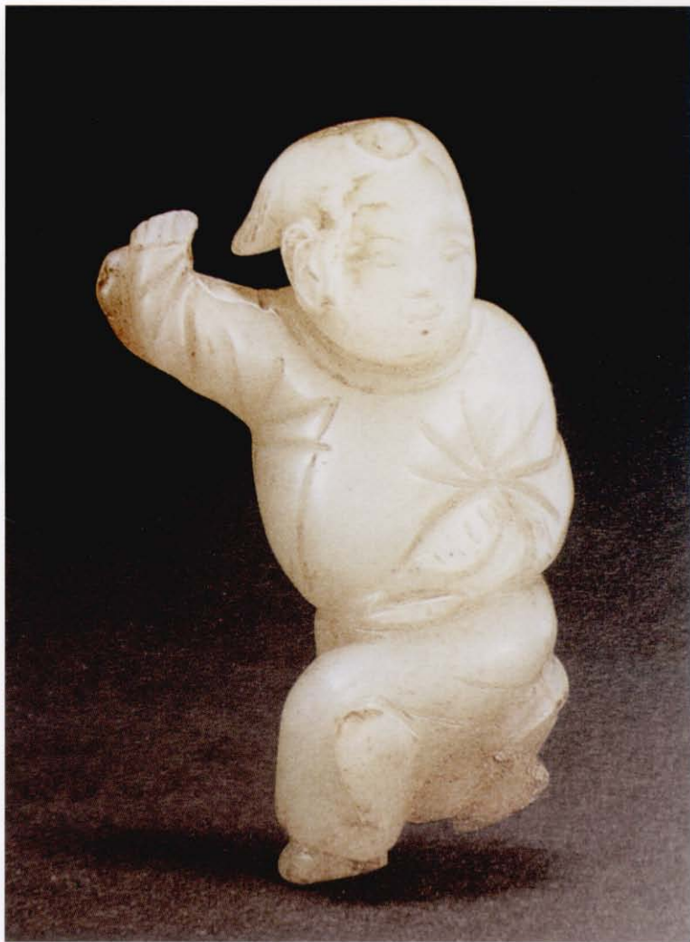
玉习武童子 宋(故宫博物院藏)