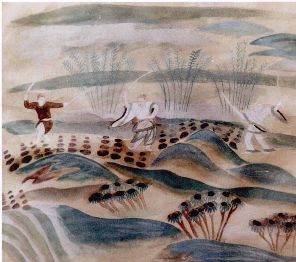
刀术壁画 五代（甘肃敦煌莫高窟第2窟窟壁画）