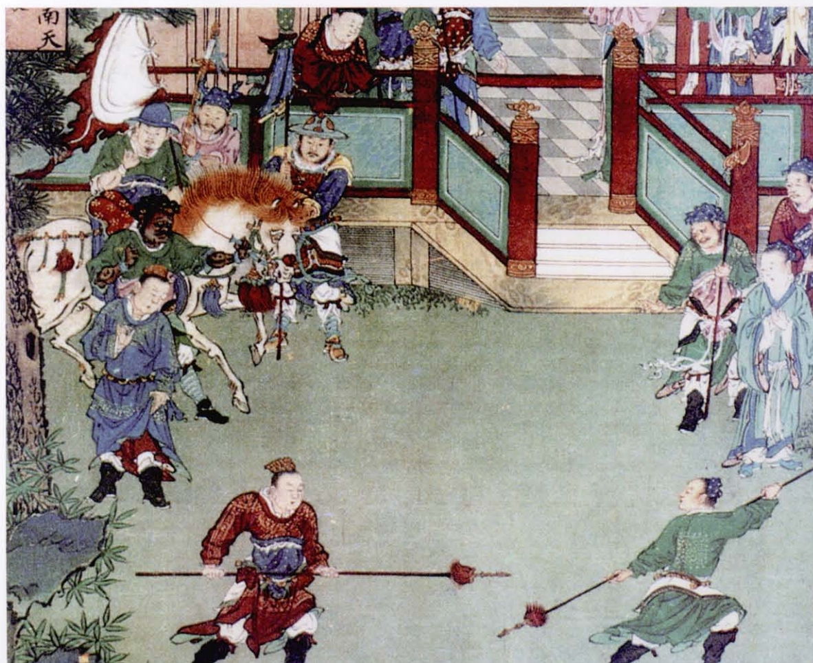
双枪技击图壁画 明（山西太原崇善寺壁画）