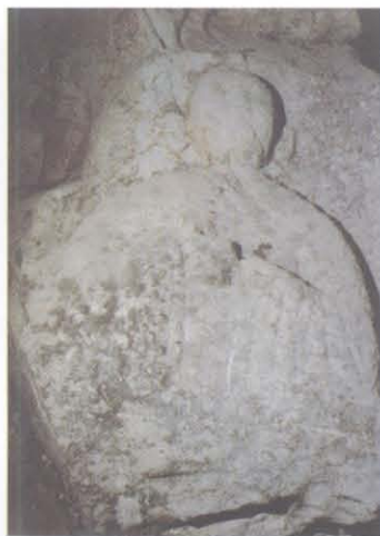
望海寺摩崖造像 9 号