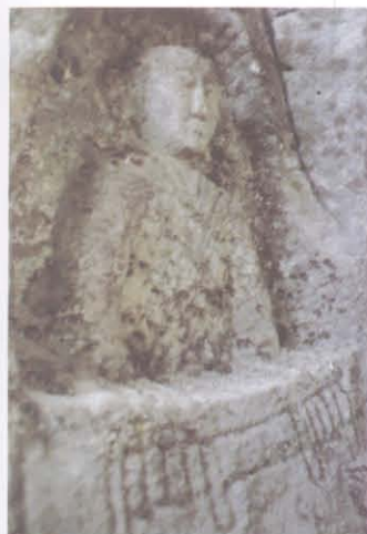
望海寺摩崖造像 6 号