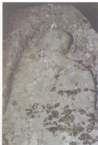
望海寺摩崖造像 10 号