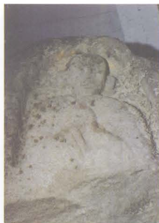
望海寺摩崖造像 5 号