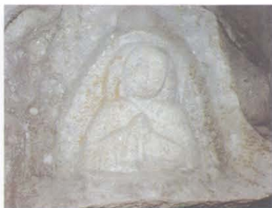
望海寺摩崖造像 7 号