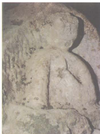
望海寺摩崖造像 2 号