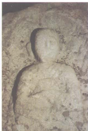
望海寺摩崖造像 1 号