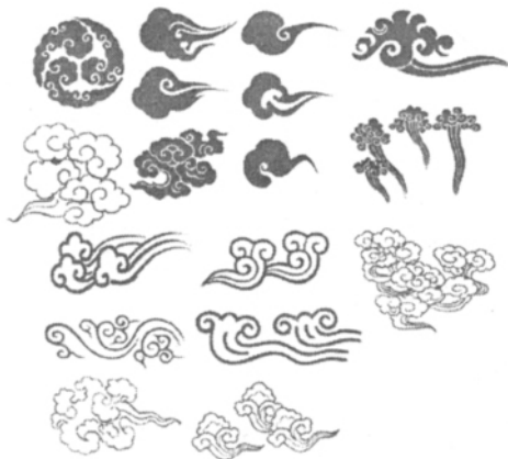
图3形式各异的云纹

在我国古代观念中,云行天空亦即为天。云为神仙驾乘飞升的工具,也是滋润万物的雨水来源,具有丰厚的文化意义。因此云素来被视为吉祥的象征,有“祥云瑞日”之说。