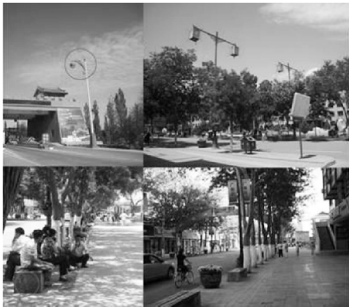
图4 敦煌城市公共设施

足游客在城市内休闲、购物、娱乐的需求,尽可能使各类旅游设施处于“静”的环境之中,要注意商业街、步行街的建设。城市道路的断面形式上,应适当加大人行道的宽度,体现敦煌的适合步行观光的特色。同时在道路铺地和材质上进行特色化设计。如,敦煌市现有的一些主要干道的步行道上,维修井盖被设计成具有敦煌特色的图案,让人觉得走在路上比较具有趣味性。对于道路的配套设施设计,如路灯、路标、休闲座椅等,都是体现城市人文特色并与人们息息相关的设施,可以将莫高窟的文化符号加以运用,使人感到敦煌与众不同的文化气质。走在敦煌,随处可见以飞天为设计元素的路灯,这种路灯造型优美,设计精巧,它们有着十分丰富的文化内涵和重要的现实意义。飞天是敦煌文化的象征,也是敦煌的象征,手提宫灯的飞天似乎是在欢迎每一个来到敦煌的人,并热情地为它们引路,这一下子拉近了游