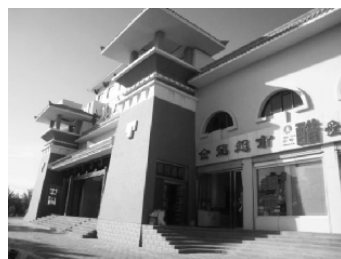
图3 敦煌市区内仿古建筑

加突出城市特色的理念,通过道路、建筑、公共设施等方面共同打造敦煌的“丝路绿洲”的城市品牌,展现历史文化名城的特色形象。