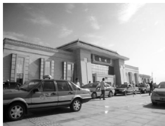
图2 敦煌新建火车站

在明显的文化特征的前提下,敦煌的城市特色一方面应该凸显莫高窟、丝绸之路等主题,几千年来,大漠和石窟壁画给人以神秘浩瀚的气息,自古以来多种文化的交流沟通在这里汇聚。因此,应该更