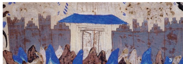
1 城阙 北凉 第275窟 南壁 2 坞堡城 北魏 第257窟 西壁 3 高耸的马面城, 西魏第249窟 西坡 4 天宫城 晚唐 第85窟 西坡 5 皇城(宫城) 初唐 第431窟 6 长安城 初唐 第323窟 南壁 7 长城图 初唐 第321窟 南壁 8 里坊城 晚唐 第85窟 北坡 9 西域城 盛唐 第217窟 南壁