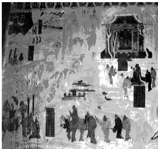
图2 敦煌莫高窟第323窟 张骞出使西域图

该插图取自敦煌莫高窟初唐第323窟主室北壁佛教感应故事画《张骞出使西域图》(图2)