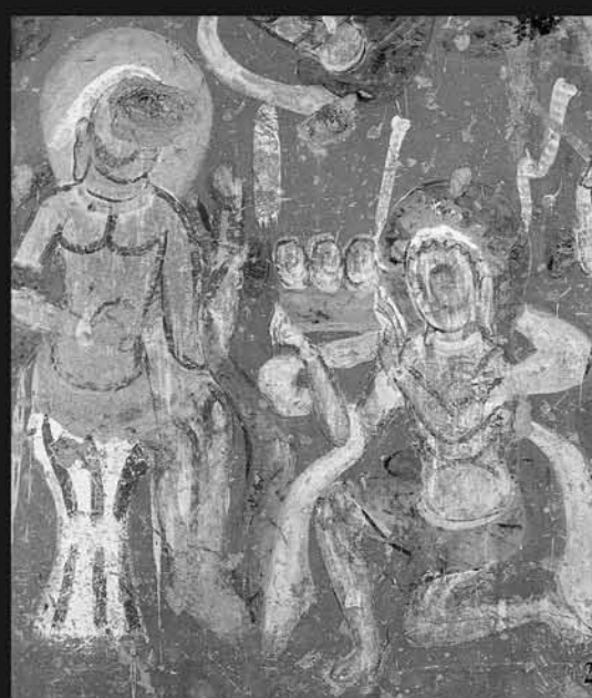
图4 敦煌莫高窟第275窟“月光王本生”壁画东腰圆龛