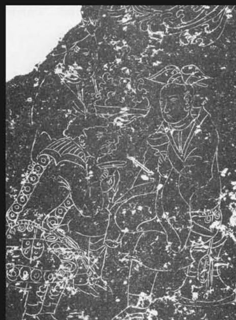
图6 青州北齐石椁画像拓本东腰圆龛