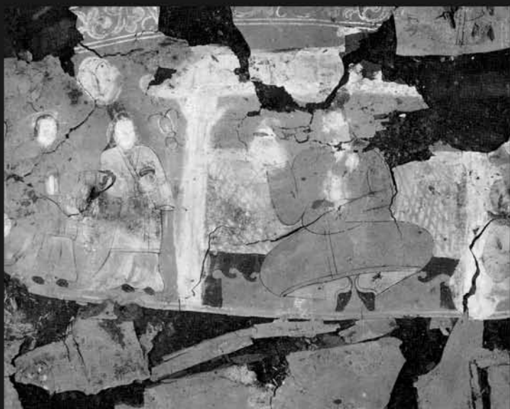
图11 宁夏固原北魏漆棺残画