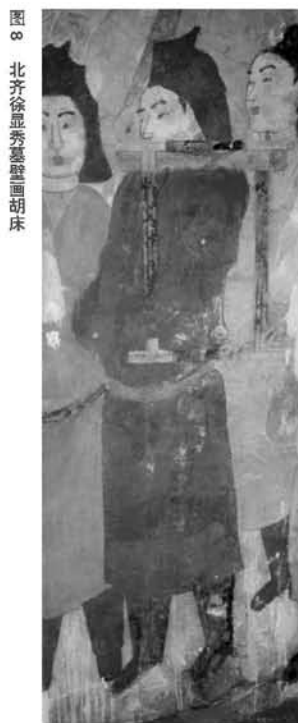
图8 北齐徐显秀墓壁画胡床