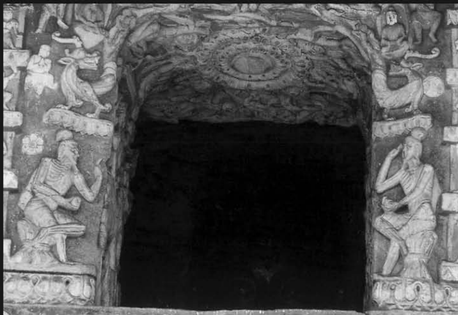
图2 云冈石窟第9窟北壁明窗旁坐东腰圆龛梵志