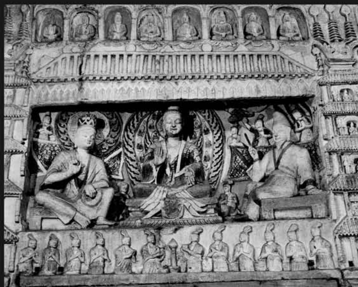
图12 云冈石窟第6窟释迦和文殊、维摩