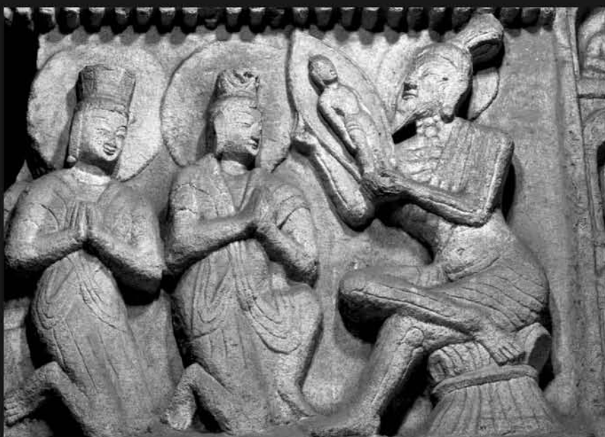
图3 云冈石窟第6窟阿私陀占相东腰圆龛