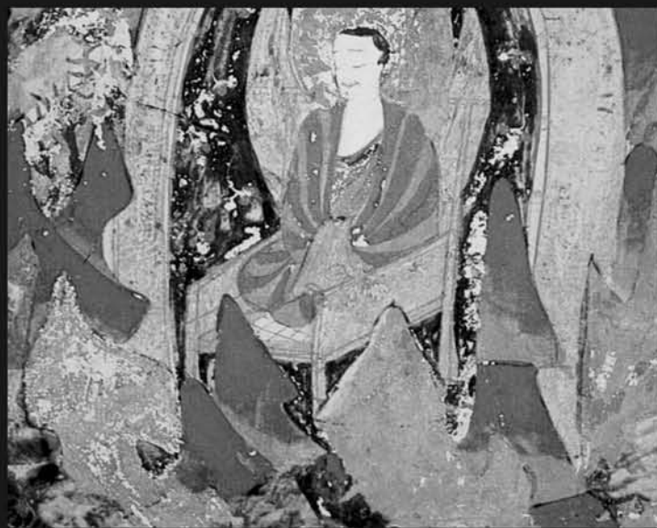
图10 敦煌莫高窟西魏第285窟窟顶北坡下部壁画椅子