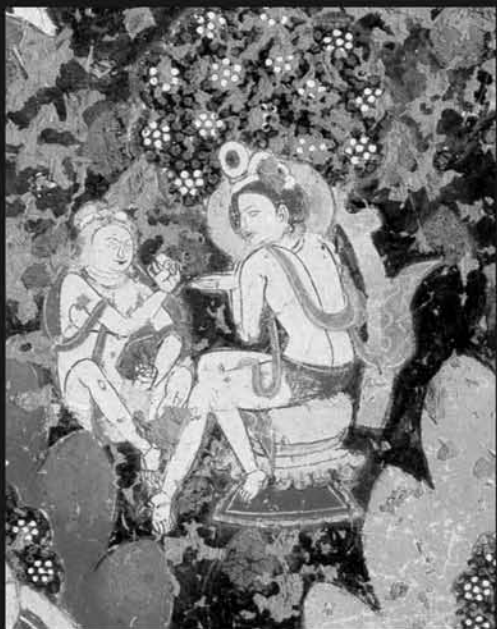
图1 克孜尔石窟第38窟主室券顶顶生壁画东腰圆龛