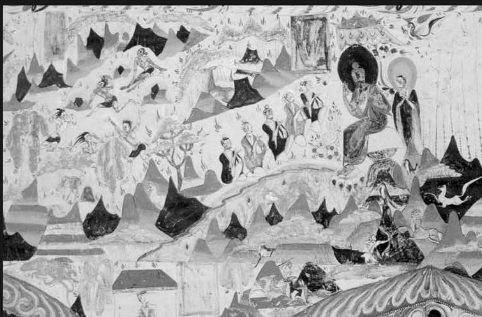
图5 敦煌莫高窟第285窟“五百强盗”壁画东腰圆龛