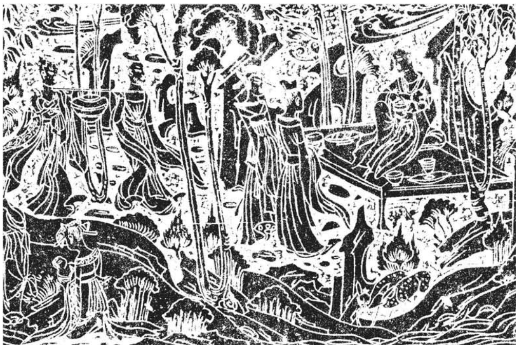
图 13 北魏孝子石棺局部拓本 大床

统年间所绘壁画中，在窟顶北披下有一列坐于草庐中的禅修人像，其中有一位禅修者正趺坐在一张椅子上 *22 。绘出的椅子形体清晰，四足，后有高靠背，两侧设扶手，（图10）这是目前所知有明确纪年的最早的椅子图像。表明至少在北朝晚期，这种新式的高足坐具已经出现在人们的生活中。