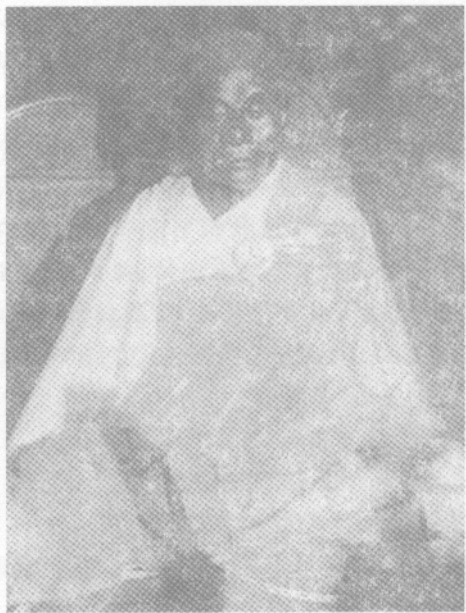
禅宗南宗创始人慧能

上面指出了文殊师利菩萨的主要禅法——一行三昧的意义及其般若行和念佛行两种修持方法,下面谈谈它对中国禅宗祖师慧能大鉴禅师的巨大影响。