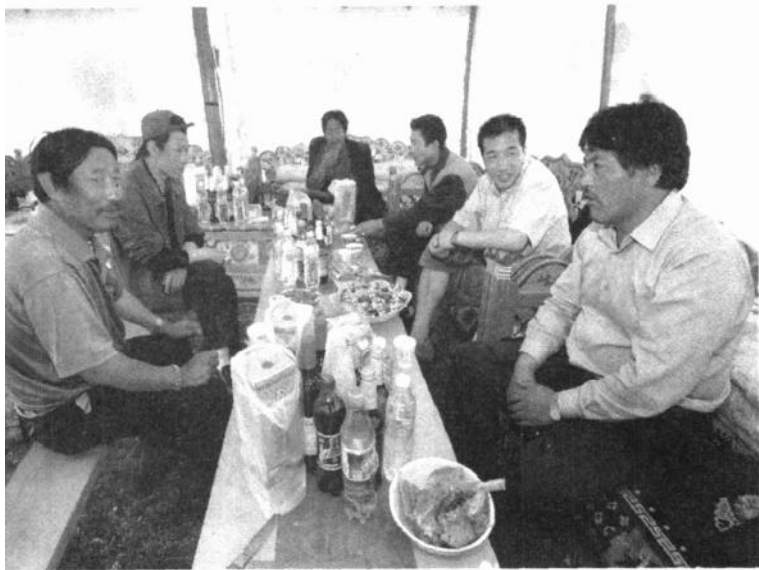
酥油茶是藏族同胞们聚会时不可少的饮料

除了川茶以外,在抵御印茶的经济侵略上,滇茶的作用也不小,甚至可以说,滇茶在一定程度上阻止了英帝国主义对西藏进行经济侵略的步伐。辛亥革命后,印茶大量倾销西藏,川茶在西藏的市场日渐缩小。在政治上,康藏数度发生纠纷,使传统的康藏贸易受到阻碍,这一时期,西藏地区的川茶紧俏,广大藏族人民不愿饮用“有机油味”的印茶,而滇茶则大量通过滇藏山道和滇缅道等运至西藏,压制了印茶在西藏的影响。在那个茶贵如银的年代,各族人民的运茶马帮,走荒山,爬野岭,在川、青、滇、藏险道上往来穿梭,从未断过。