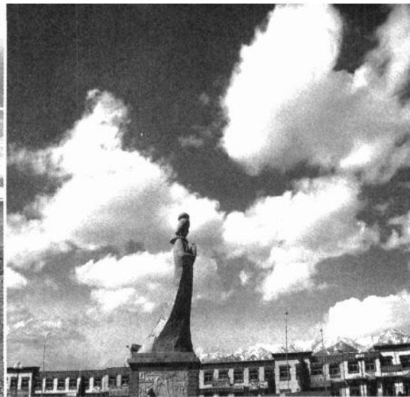
藏区的文成公主雕像