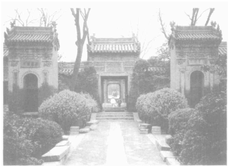
西安化觉巷清真寺