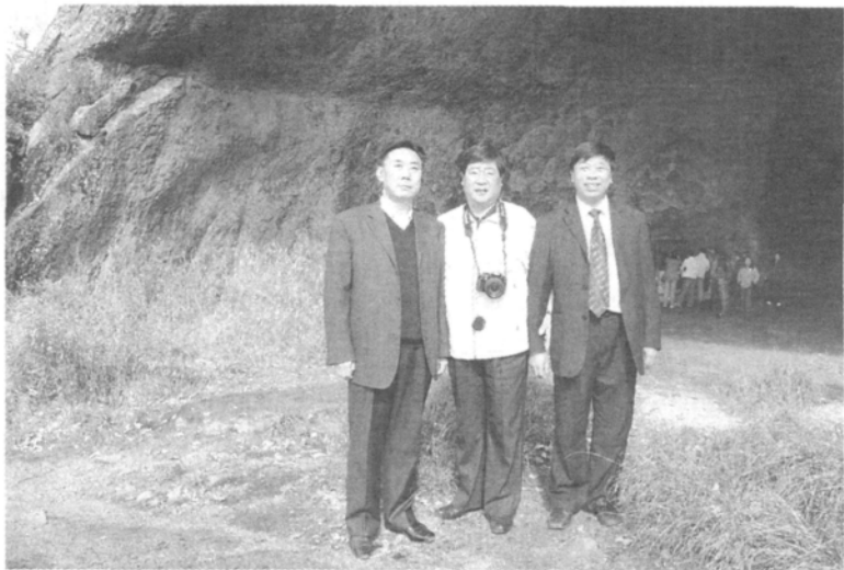
作者(中)考察鲜卑文化时在嘎仙洞前留影

开始开凿云冈石窟。公元494年拓跋北魏政权迁都洛阳,开始开凿龙门石窟。公元495年始建嵩山少林寺,并开始大规模的改革,由游牧经济转向农耕经济,由奴隶制转向封建制,禁穿鲜卑等民族的服装,禁讲鲜卑语言,改鲜卑诸姓为汉姓,帝室拓跋改为元姓,禁止死后葬在北方等,推动了经济文化的迅速发展,成为与南朝对峙的强大北方王朝,历史进入了南北朝时期。为中华民族的繁荣发展注入了新的血液,为隋唐盛世的形成奠定了基础。