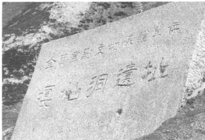
鲜卑人生活过的嘎仙洞

到秦汉时期,鲜卑族大部分占据于今内蒙古东北额尔古纳河以南,辽宁西喇木伦河以北的广大地域,臣服于匈奴,以游牧为主。公元91年,北匈奴为东汉耿种击败西迁后,鲜卑族占据了漠北广大地区,未能迁走的十万余匈奴皆被吸收到鲜卑族内。从此,鲜卑成为匈奴之后的一个北方强大的民族。鲜卑各部为檀石槐统一,形成了一个强