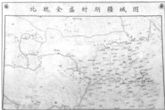
北魏全盛时期疆域图

孤在廉川堡(今民和史纳)建立了南凉政权。后经历三王,迁都西平(今西宁)、乐都,在湟水流域立国,于公元414年被鲜卑王国西秦所灭。