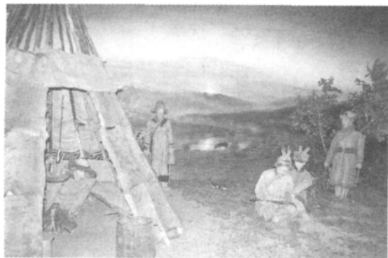
鲜卑族先民生活复原图