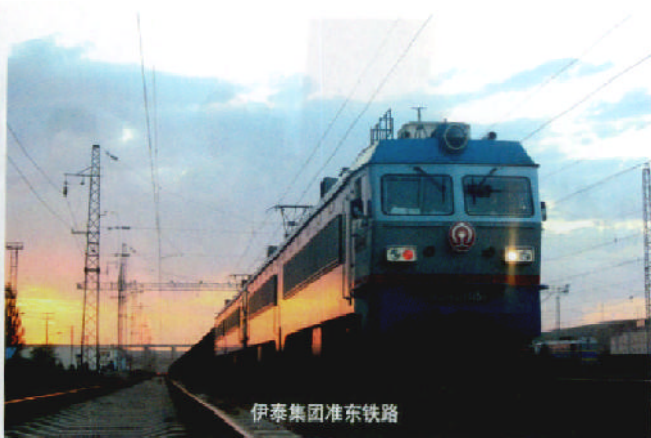
伊泰集团准东铁路