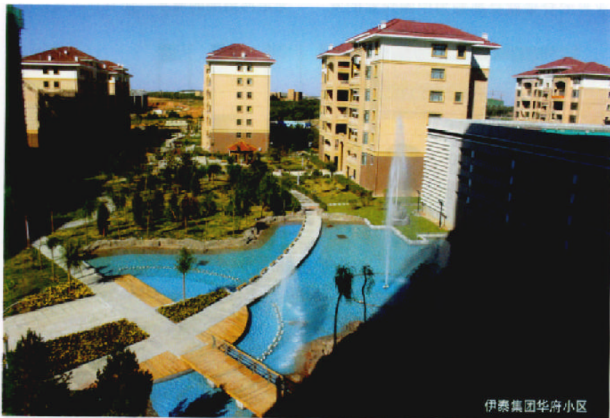
伊泰集团华府小区

在发展绿色环保能源方面,从2006年1月起,伊泰集团太阳能聚光光伏发电示范电站项目在国家发改委、内蒙古自治区和鄂尔多斯市党委政府及有关部门的支持下,依托太阳能数倍聚光光伏发电技术,已在鄂尔多斯市建成国内装机最大、关键技术指标达到国际领先水平的205千瓦太阳能光伏电站,年总发电量超过59.86万千瓦时,是我国太阳能聚光光伏技术第一个科研示范电站。该项目清洁、环保、无公害,填补了国内空