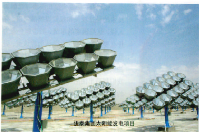
伊泰集团太阳能发电项目