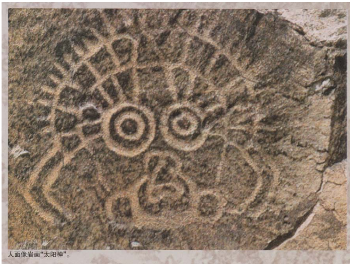
人面像岩画“太阳神”。