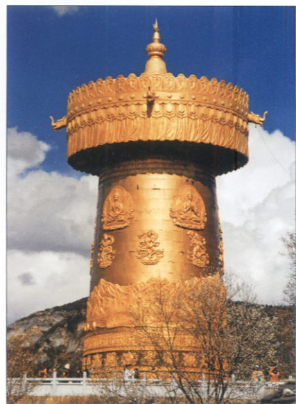
大龟山上世界最大的转经筒