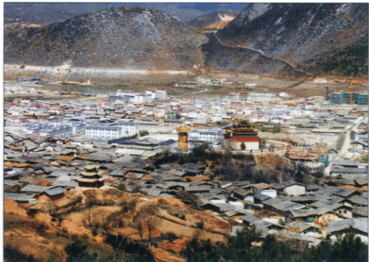
八瓣莲花布局的独克宗古城