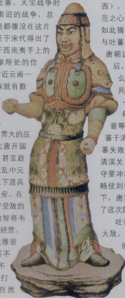
唐代贴金彩绘武士俑

贞元九年（公元793年），朝廷筑盐州城（今宁夏盐池县），这座城就在吐蕃的眼皮底下，吐蕃当然不会看着它就这样完工。为了保证城池的安全竣工，韦皋又一次主动进攻，攻破吐蕃峨和（今四川松潘叠溪营北60里永镇桥）、通鹤、定廉城（今四川阿坝理县），逾的博岭，包围维州（今四川理县东北），搏栖鸡，攻下羊溪等三城，还把吐蕃的定廉城一把火烧了。吐蕃的南道