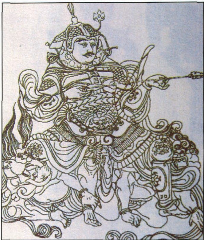
唐代武士图，从其神态和装束可以想见当年韦皋雄姿英发的样子

韦皋要是放到现在，可以说是一个完美男人，打仗方面是一把好手，用英雄称他毫不为过。既然是英雄，那肯定有佳人作伴，所谓“醒掌天下权，醉卧美人膝”。当时在蜀地有个名妓叫做薛涛，她本是官宦人家大小姐，由于父亲早逝，为了维持生计只能抛头露面以诗乐娱客。韦皋早就听闻了薛涛的才华，就请她应席赋诗。薛涛不假思索立题“谒巫山庙”一诗：“乱猿啼处访高唐，一路烟霞草木香；山色未能忘宋玉，水声尤是哭襄王。朝朝夜夜阳台下，为雨为云楚国亡；惆怅庙前多少柳，春来空斗画眉长。”韦皋大加赞赏，于是薛涛就成了帅府常客，为他处理一些文书上的工作，其实就是女秘书。因为工作出色，韦皋想让薛涛担任校书郎的官职。但无奈她身份卑微，只好作罢。虽然未能真正成为校书郎，但是薛涛的才华早就被大众所承认。她逝世以后，剑南节度使段文昌为她亲手题写了墓志铭：“西川女校书薛涛洪度之墓”。由此“女校书”便成为了后世对那些才貌双全的妓女的最高评价。